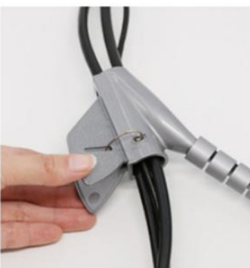
5.准备把包线管插入导线夹上