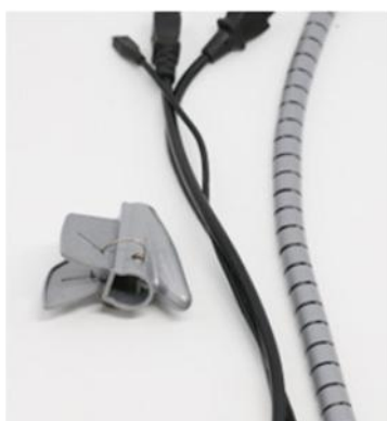
1.导线夹、线缆、包线管