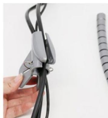
3.把线缆放入导线夹里面