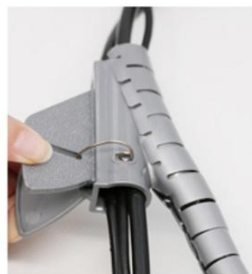
6.包线管通过导线夹包住电缆