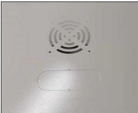
顶部风扇安装孔 (孔距 105*105mm)