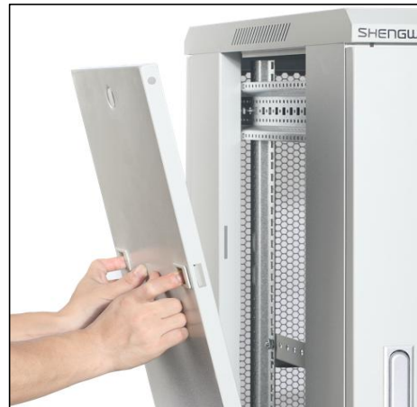
卡扣式可拆卸侧板